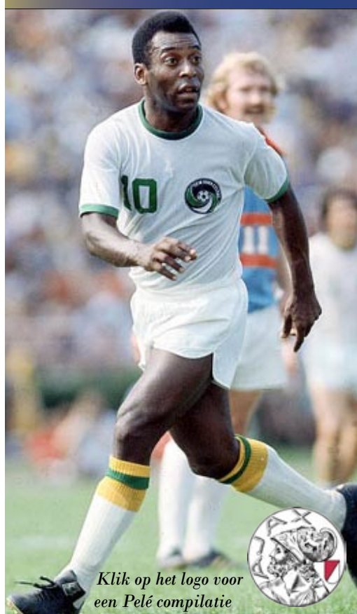
Klik op het logo voor een Pelé compilatie